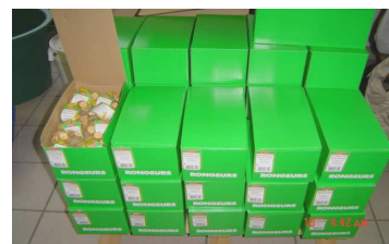
Conditionnement de rondins