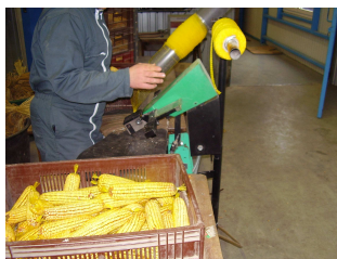
Conditionnement de Maïs pour rongeurs