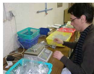
Comptage et contrôle de visserie

Téfal Société Schneider Electric Société Girard Société Multilox Société Somagic