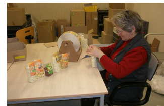
Ensachage de friandises pour rongeurs