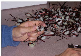
Démontage de tores

Ces activités de sous-traitance sont liées à un partenariat de confiance, pour certains depuis plus de 20 ans, auprès de nos donneurs d'ordres.