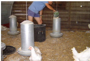
Remplissage des mangeoires