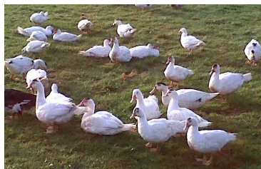
Canards dans un parc