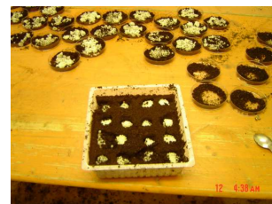
Démoulage pontes d'escargots