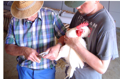
Pose d'une bague d'identification